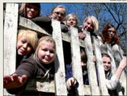
Vuoden nuorisokuoroksi valittu Laurus esiintyy Ritarihuoneella sunnuntaina.

Vappunakin on näillä lämpymien tarjolla hyviä terassikelejä. | SIVU 4