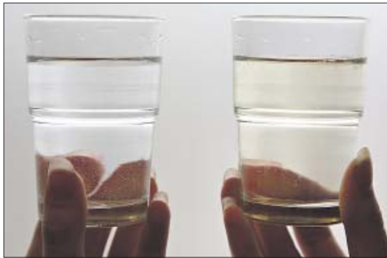
Vantaanjoen vesi (oik.) kirkastuu melkoisesti, kun se puhdistetaan juomavedeksi (vas.).